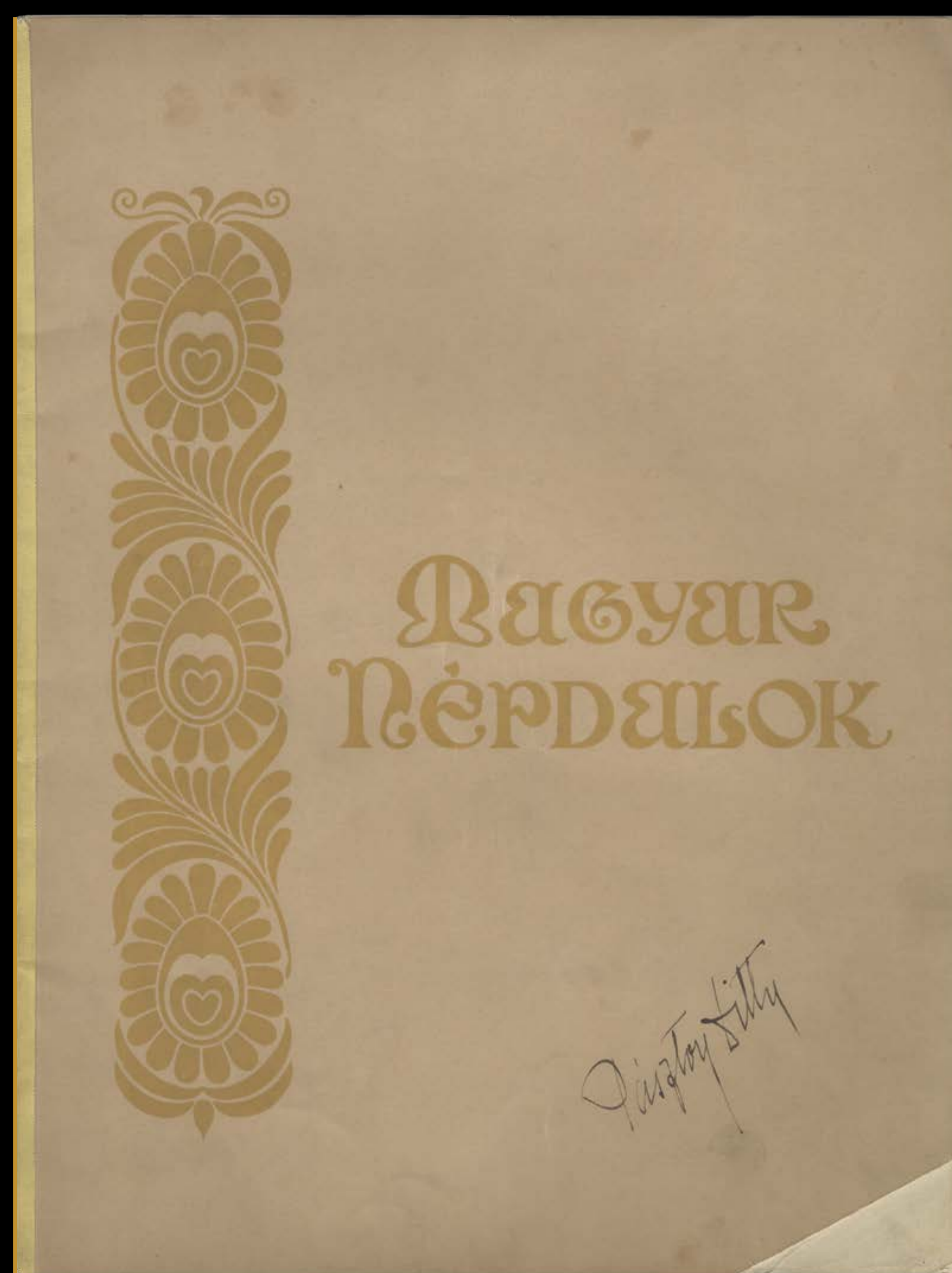
Magyar népdalok, Bartók és Kodály nagyközönségnek szánt húsz népdalfeldolgozása, 1906