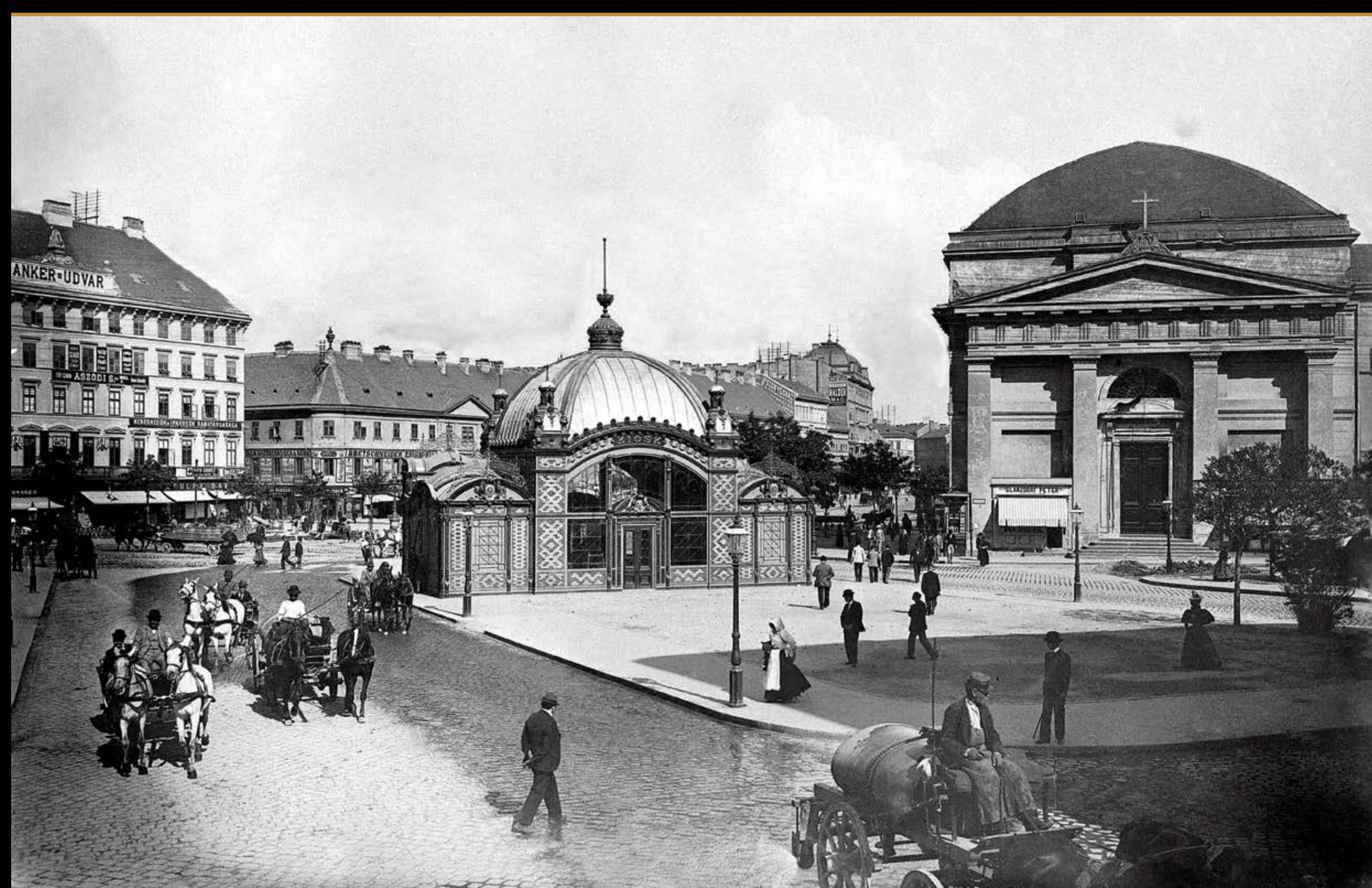
Budapest – Deák tér, korabeli fénykép