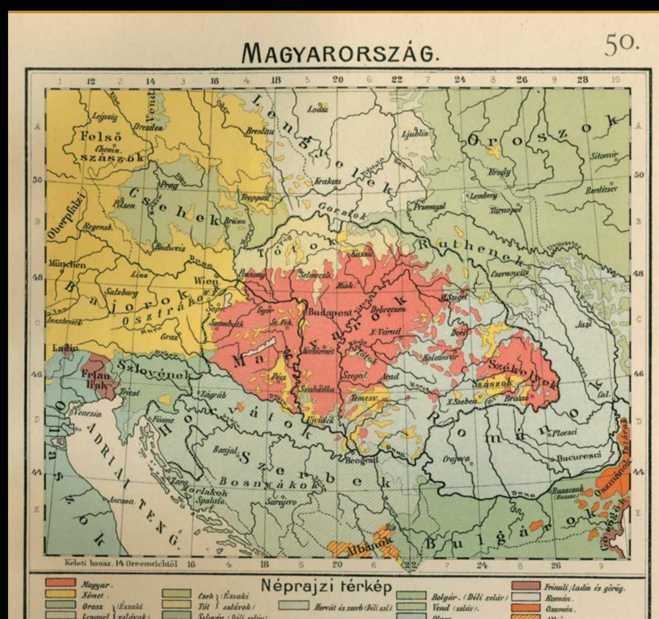
Magyarország néprajzi térképe egy 20. század eleji atlaszban

Bartók, „Népdalkutatás és nacionalizmus”, 1936