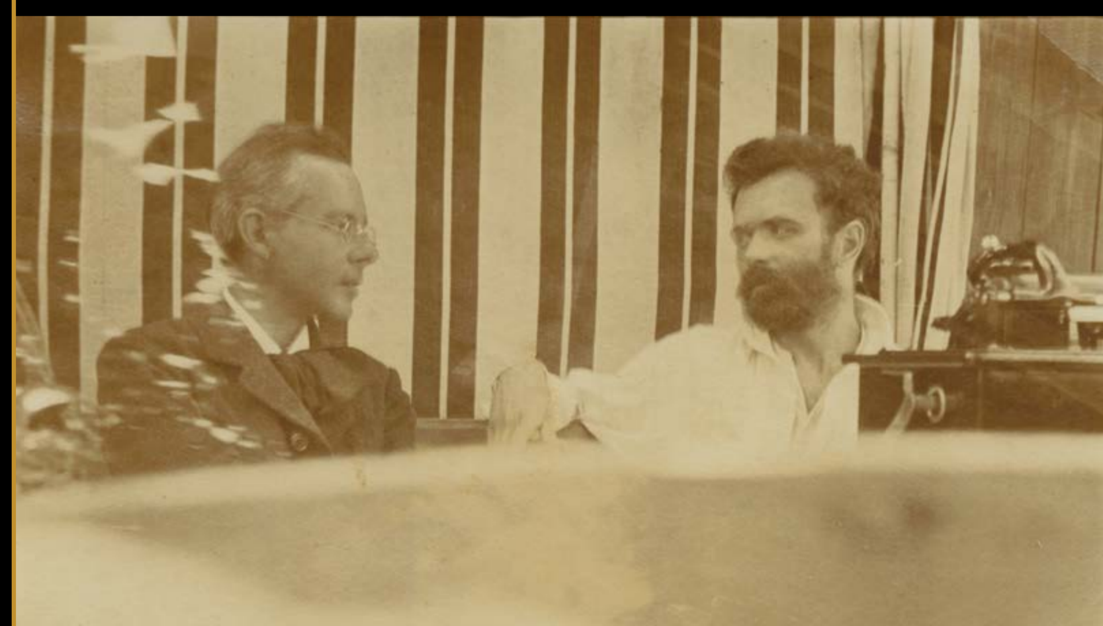
Bartók német nyelven fogalmazott önéletrajzának Kodályra és a népzene kutatásra vonatkozó részlete, 1918