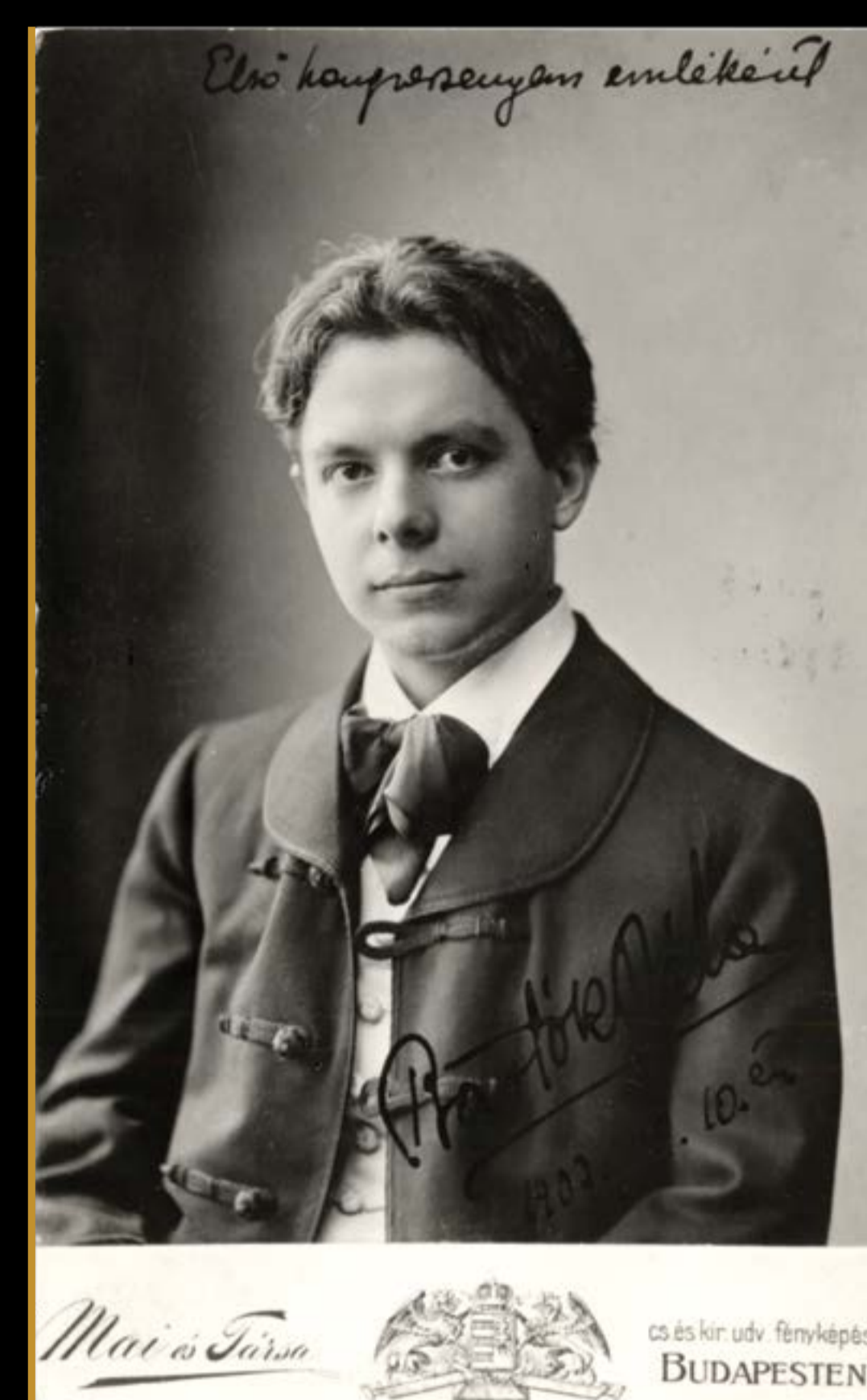
Bartók nemzeti viseletben, 1903

Bartók levele édesanyjának, 1903. szeptember 8.