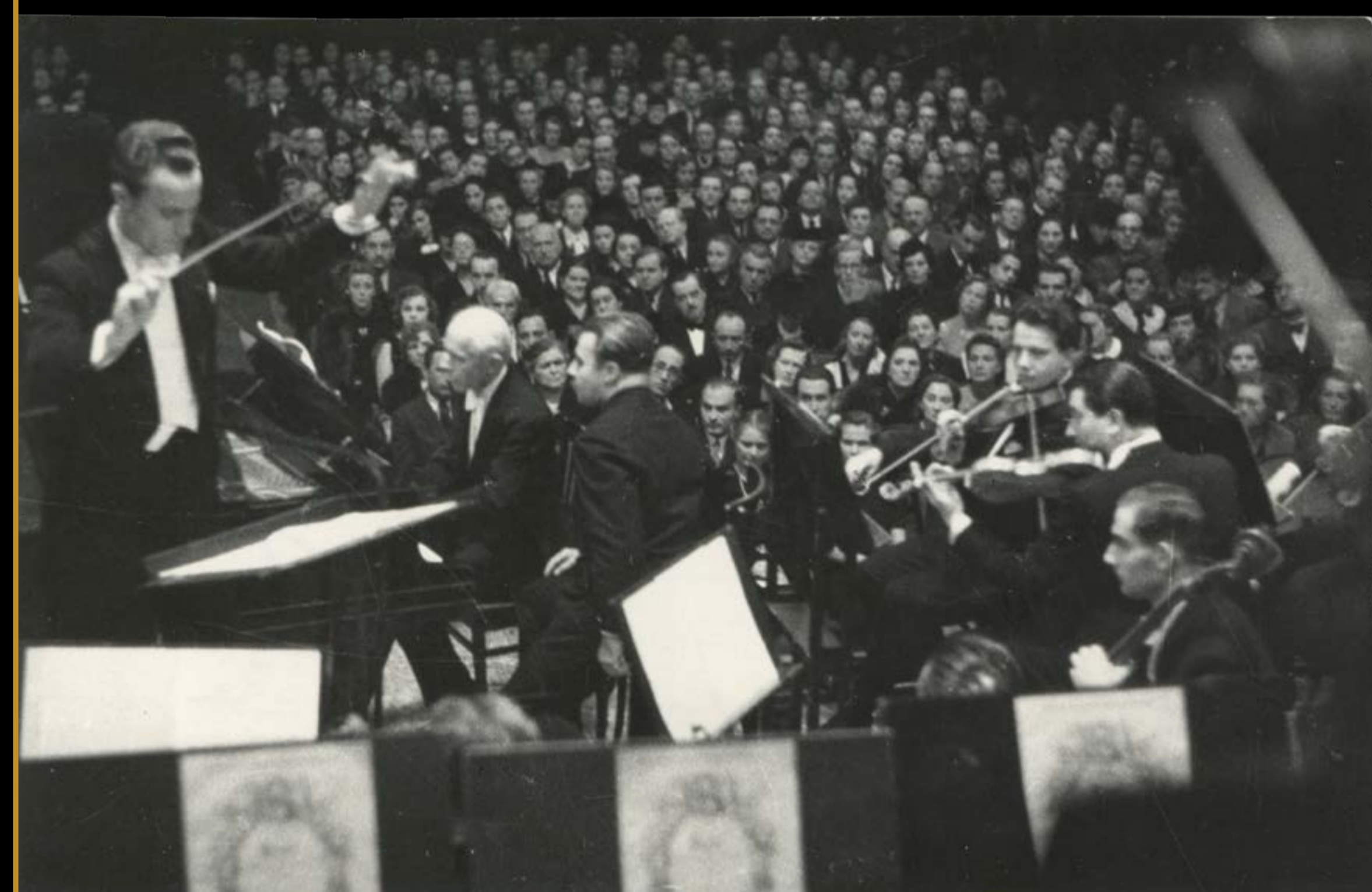
Bartók budapesti búcsúhangversenye, 1940. október 8.

Október 8-án még búcsúhangversenyünk volt Budapesten [...] végül én a Mikrokozmoszból adtam elő. És most itt vagyunk szomorú szívvel és Önnek és kedveseinek búcsút mondunk – hogy mennyi időre, vagy talán örökre, ki tudja –! [...]