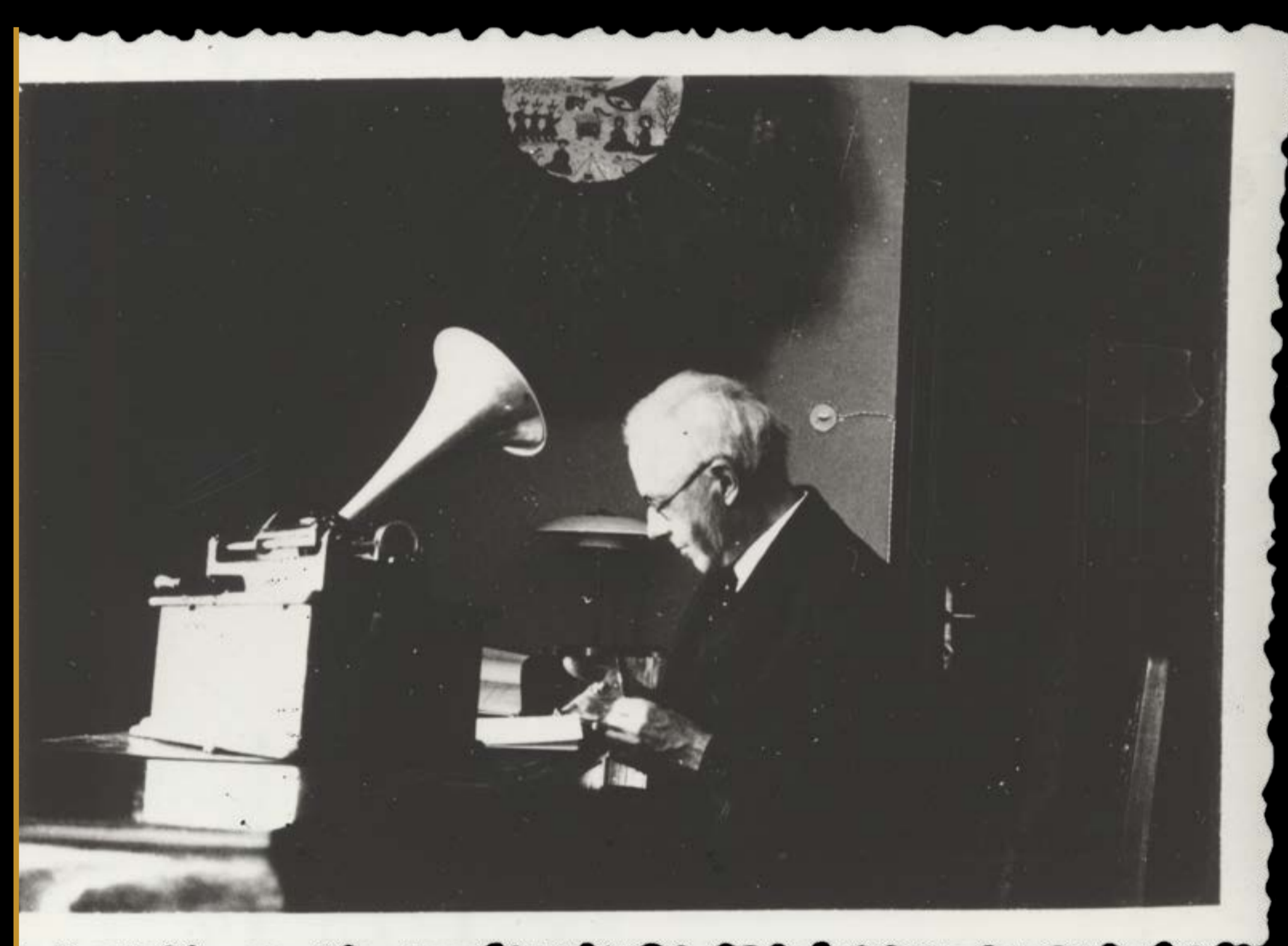
Bartók a bukaresti Folklórintézetben, 1934