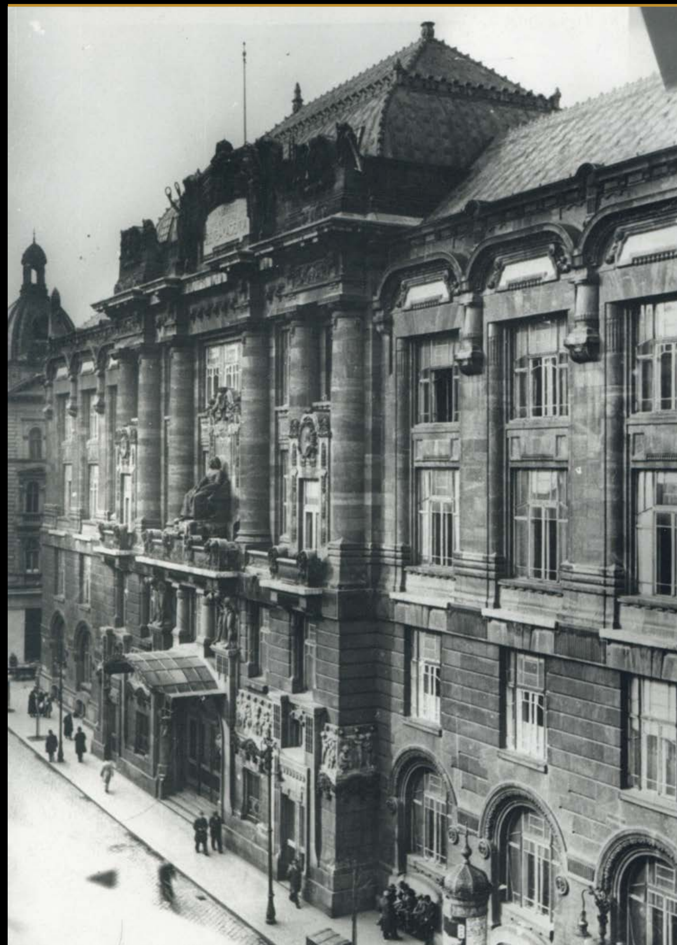
A budapesti Zeneakadémia homlokzata, korabeli felvétel

Bartók levele Müllernének, 1940. október 14.