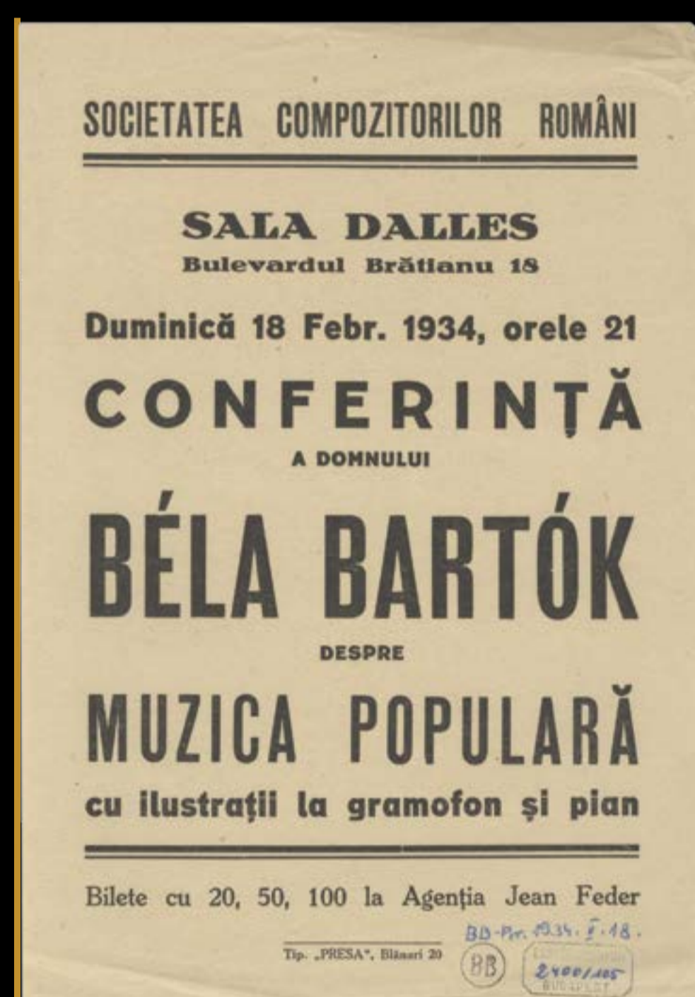
Bartók tudományos előadása a népzeneről Bukarestben, 1934. február 18.

Az én zeneszerzői munkásságom, épp mert e háromféle (magyar, román és szlovák) forrásból fakad, voltaképpen annak az integritás-gondolatnak megtestesüléseként fogható fel, [...] amelynek, mióta csak, mint zeneszerző magamra találtam, tökéletesen tudatában vagyok: a népek testvérré-válásának eszméje, a testvérré-válás minden háborúság és minden viszály ellenére. Ezt az eszmét igyekszem – amennyire erőmtől telik – szolgálni zenémben; ezért nem vonom ki magam semmiféle hatás alól, eredjen az szlovák, román, arab vagy bármiféle más forrásból. Csak tiszta, friss és egészséges legyen az a forrás!