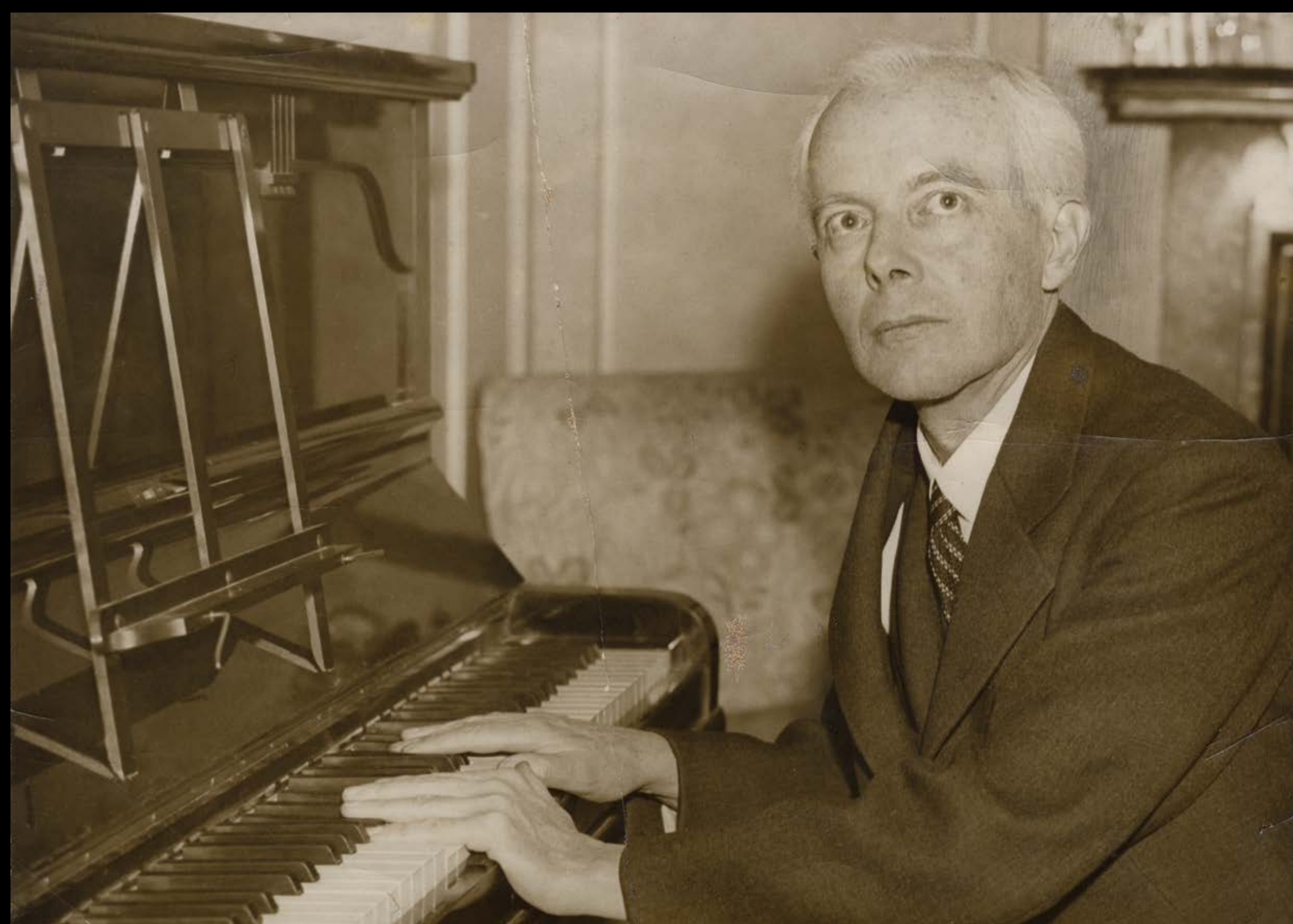
Bartók, London (1936)

K elet és Nyugat kölcsönhatása Bartók Bélában, az utolsó nagy romantikus zeneszerzőben találta meg legtökéletesebb kifejeződését. [...] Kompozíciói gondolatiságukban és felépítésüket tekintve a zenetörténet legnagyobbjai közé tartoznak. [...] Büszkeség, fájdalom, öröm, komolyság, meditáció és humor meggyőzően fejeződnek ki Bartók minden egyes hangjában, a legrövidebb, néhány ütemnyi művektől a nagylélegzetű szimfonikus és kamarazenei alkotásokig.