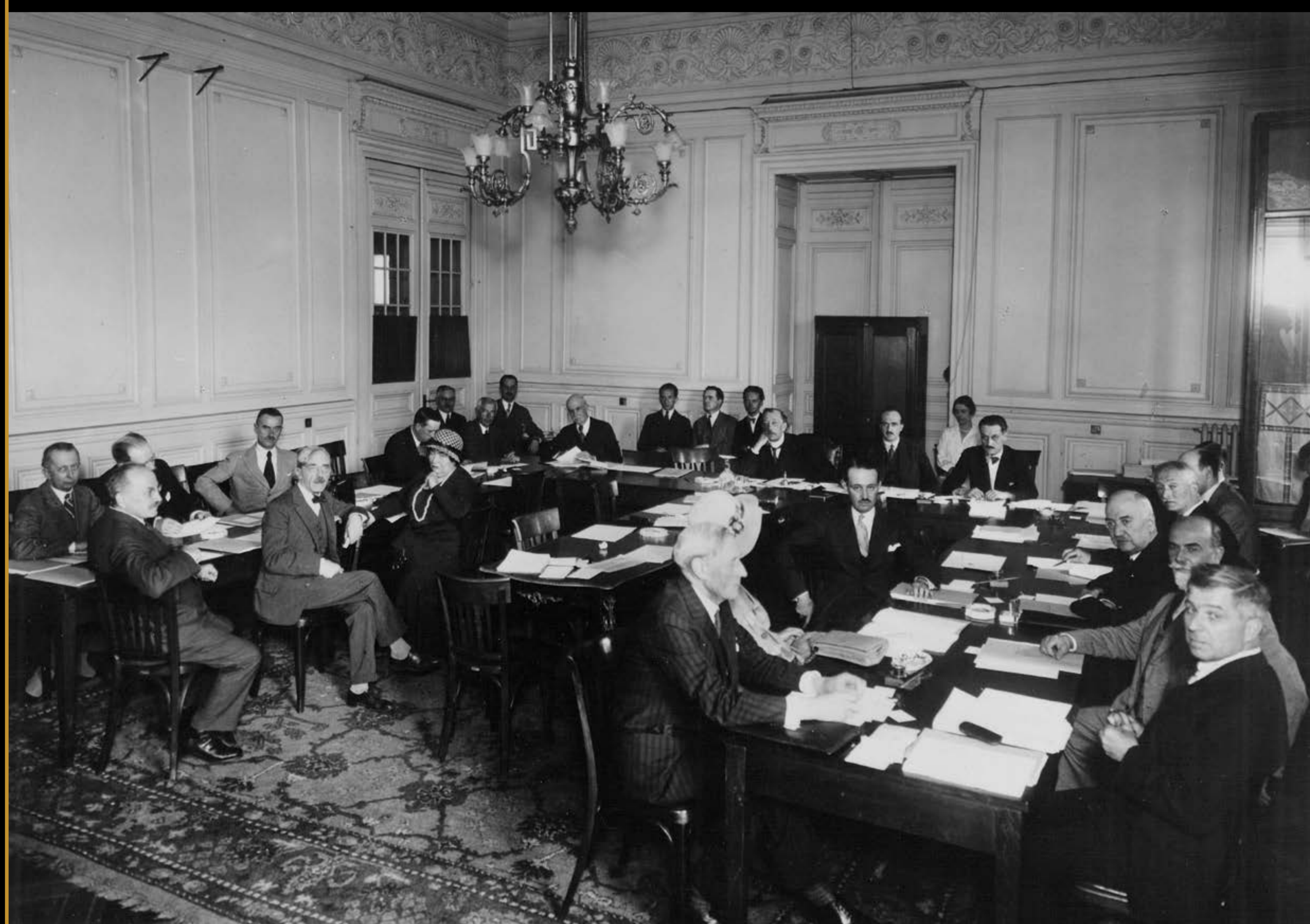
A Népszövetség Szellemi Együtműködés Művészeti és Irodalmi Bizottságának genfi ülése, 1931, a résztvevők között Karel Čapek, Henri Focillon, Thomas Mann, Paul Valéry – és Bartók

Volt egy öreg apó, Volt néki, volt néki Kilenc szép szál fia. Nem nevelte őket Semmi mesterségre, Csak erdőket járni Csak vadat vadászni. És addig-addig Vadászgattak, addig: Szarvassá változtak Ott a nagy erdőben. És az ő szarvuk Ajtón be nem térhet, Csak betér az völgyekbe; A karcsú testük Gunyában nem járhat, Csak járhat az lombok közt; A lábuk nem lép Tűzhely hamujába, Csak a puha avarba; A szájuk többé Nem iszik pohárból, Csak tiszta forrásból.