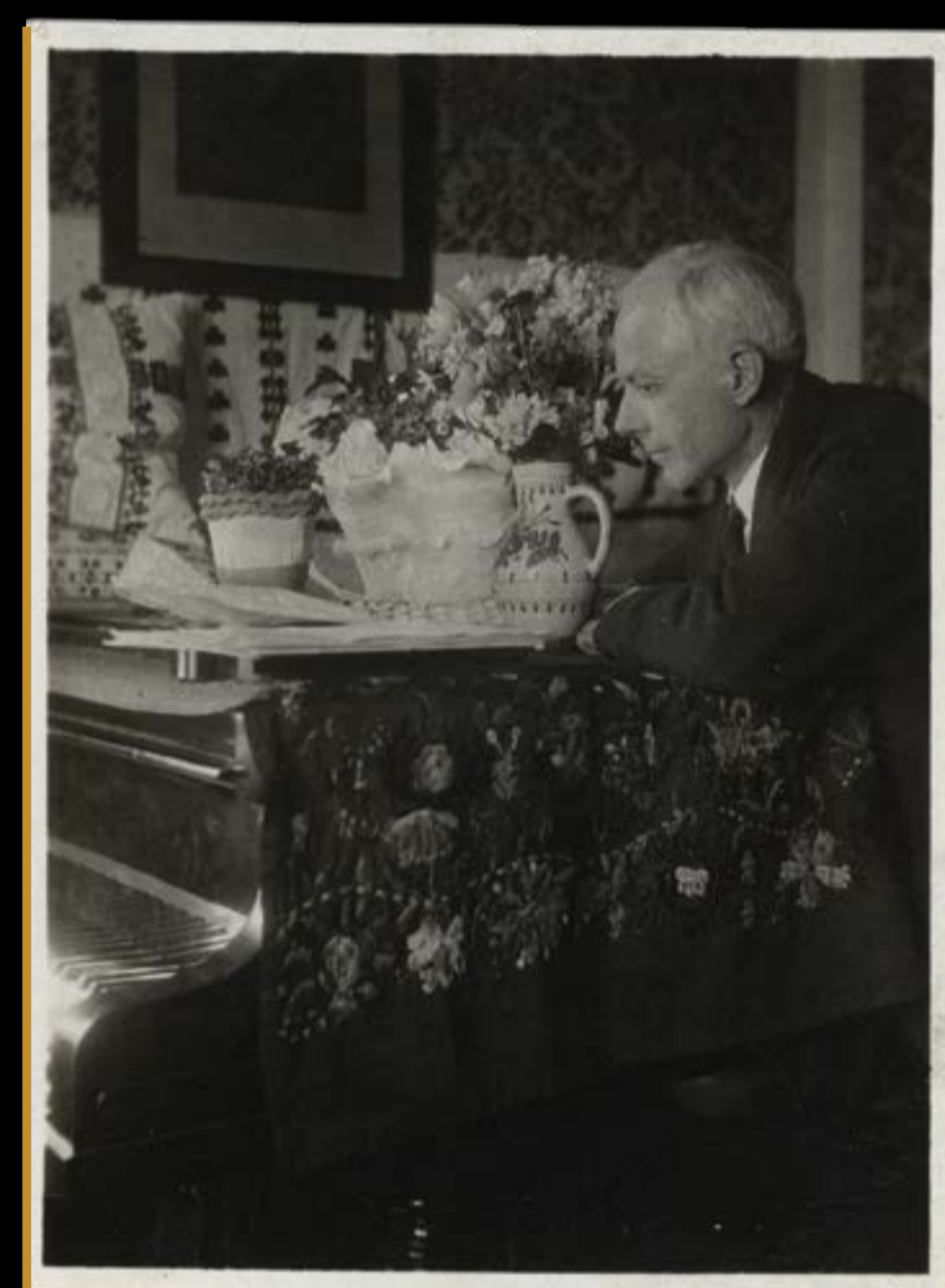
Bartók 50. születésnapján otthonában, 1931